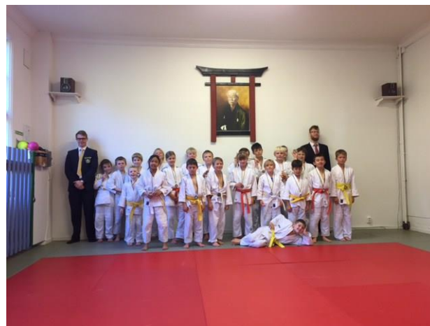
På korten ovan ses våra judokas tillsammans med jk budo och Lerums jk.

Här ser vi lite kort från Go-cup. Till höger en stilig kesa-gatame.